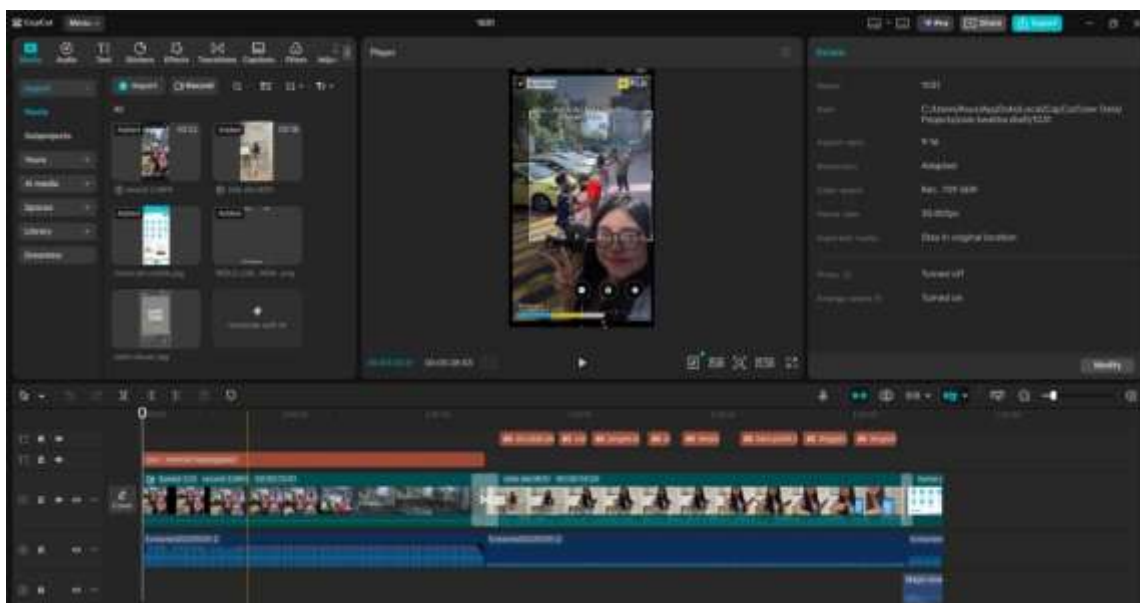
Gambar 3. Proses Editing video Konten.