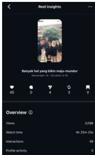
Gambar 4. Hasil Insight Instagram dari salah satu konten yang Penulis buat.